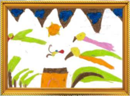
උදෑසන අසිරිය මලිනි සදුප්‍රසා තෙන්නකෝන්-2 ශ්‍රේණිය (ටී.එම්. තිලකරත්න - නිකවැරටිය ශාඛාව)