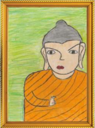
බුදුහාමුදුරුවෝ රනුක සුවසේ මෙන්ඩිස්-5 වසර (සුනන්ද මෙන්ඩිස් - ප්‍රධාන කාර්යාලය)