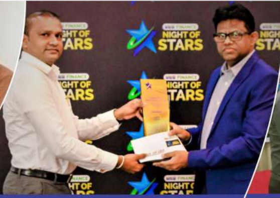
ජයග්‍රාහක ශාඛාවට හිමි තිළිණ ප්‍රදානය