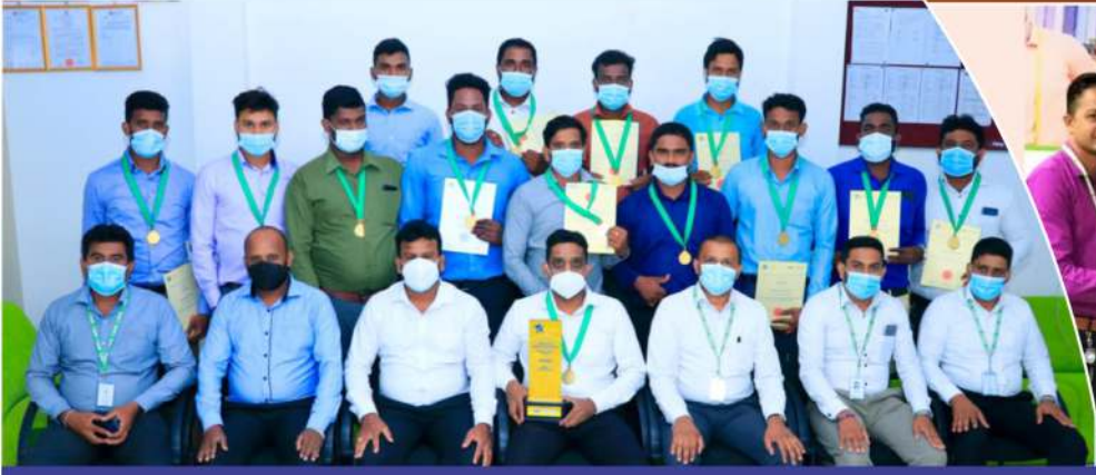
හොඳම සේවා මධ්‍යස්ථානය - මල්ලවි