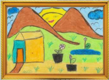
අපේ ගෙවත්ත අනුකි ඔකිත්තා