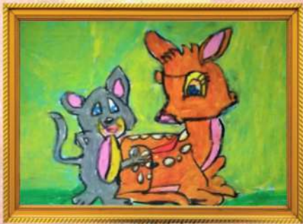
යාළවෝ සයුරි අමානා දිව්‍යාංජලි-5 ශ්‍රේණිය (තිශාන්ත ප්‍රදීප් කුමාර)