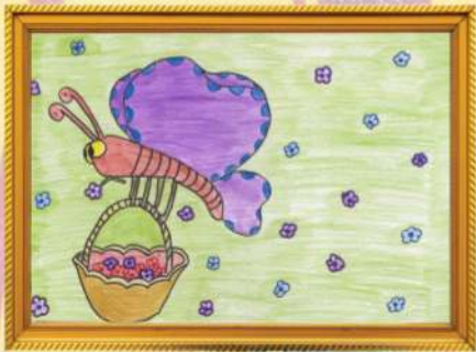
සමනල පැංචා තරුලි ලියන්සා-5 ශ්‍රේණිය (ලසන්ත සංජීව - ප්‍රධාන කාර්යාලය)