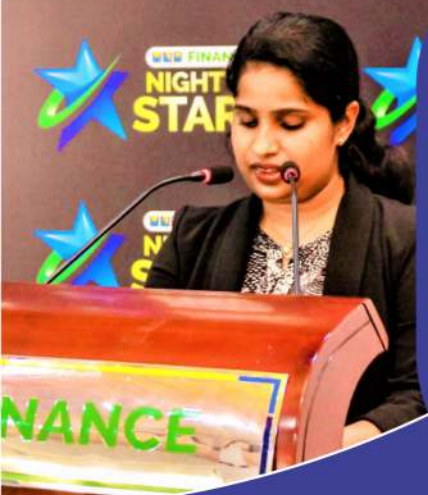
පුරක කාර්ය ඉටුකළ ප්‍රියන්තිකානී