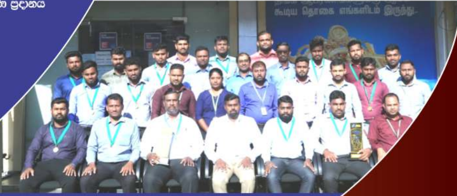
හොඳම ශාඛාව සහ ප්‍රාදේශිකය ලෙස යාපනය අභියසෙස් ලබා...