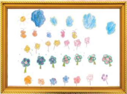
මල් වත්තක් සිතාරා මෙන්සදී තන්ත්‍රිගේ තැපි කිඩි පෙර පාසැල (බුද්ධික තන්ත්‍රිගේ ප්‍රධාන කාර්යාලය)