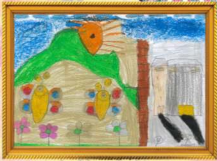
අපේ ගෙවත්ත සෙනුම් යුතාරා-2 ශ්‍රේණිය

"සිත්තර යාළ" චිත්‍ර පිටුව වෙන්වෙලා තියෙන්නේ එච් එන් ඩී ගයිනැන්ස් කාර්ය මණ්ඩලයේ ඔබේ දුවගේ ප්‍රකාශන නිර්මාණ කුසලතාව එළි දැක්වීම පිණිසයි. "සිත්තර යාළ චිත්‍ර පිටුව ඔස්සේ ඔබගේ දුවගේ ප්‍රකාශන කුසලතාව එළිදැක්වීමට ලැබෙන මේ මාහැඟි අවස්ථාව ප්‍රයෝජනයට ගෙන ඔබේ දරුවාගේ චිත්‍ර නිර්මාණ" සංස්කාරක, චිත්‍ර පිටුව, මෙහෙවර HNB ගයිනැන්ස් ගොඩනැගිල්ල, අංක 168, නාවල පාර , නුගේගොඩ. යන ලිපිනයට නොපමාව යොමු කරන්න.