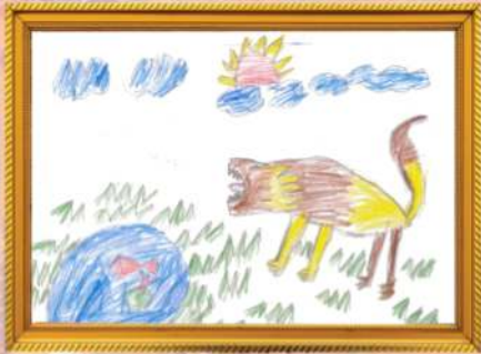
වතුර බොන්න එන කොටියෙක් එන්.පී. නෙතුම් භාෂිත පිලපිය-1 ශ්‍රේණිය (උපාලි ජයවර්ධන - වැලිමඩි ශාඛාව)