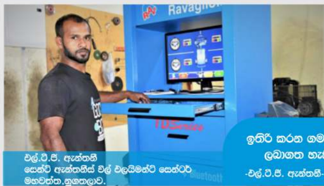
එල්.ටී.ඊ. ඇන්තනි සෙස්ටි ඇන්තනිස් එල් වලයිමන්ට් සෙන්ටර්, මහවිත්ත, නුගහලාව.

අනවශ්‍ය රස්තියාදුවීම් වලින් තොරව කිසියම් සැලසුමක් ඇතිව ව්‍යාපාර කටයුතුවල නියැලෙන්න පුළුවන්. ව්‍යාපාරය සඳහා ණය ගන්නා වගේම පනුගිය කාලේ HNB Finance සමාගමෙන් ත්‍රීවිලර් එක්ක ගන්න ලිසි පහසුකම්කුත් ලබාගන්න. වෙළෙන්ඳො අපි ළඟටම ඇවිත් මිලදී ගැනීම් කරන නිසා වෙළෙඳපොළ සොයා යාමේ ප්‍රශ්නයක් අපිට ඇති වෙන්නේ නෑ. ආදායම් තත්වය හොඳ නිසා බෙහෝම ඉක්මනට තව ඉඩමක් අරන් මේ වගාව තව පුළුල් කරන්නයි හිතන් ඉන්නේ HNB Finance සමාගමත් එක්ක බැඳුණු මේ හිතවත්කම නිසා අපේ ජීවිත වලට ලැබුණේ විශාල ශක්තියක් බව නම් නොකියාම බැහැ. ■